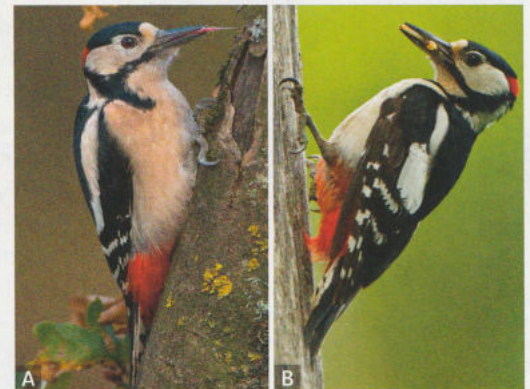
2 Nahrungssuche des Spechtes. A lange Zunge, B frisst Larve